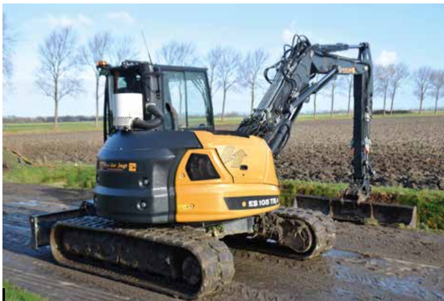
De Eurocomach midigraver is standaard erg compleet uitgevoerd en heeft een Stage IV motor.