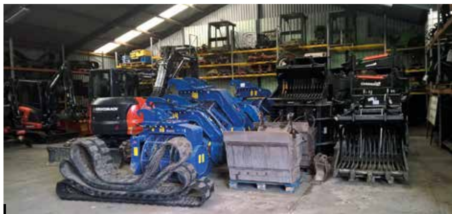
Guaita & Schoorl beschikt over een ruime voorraad aan machines en aanbouwdelen.

De markt voor minigravers is zeer groot. Logisch dus dat menig fabrikant hiervan een graantje mee willen pikken. In de voorbije jaren hebben veel merken een serie eigen minigraafmachines gelanceerd, al dan niet in samenwerking met andere fabrikanten. Ook enkele Chinese producenten hebben geprobeerd voet aan de grond te krijgen tegen zeer aantrekkelijke prijzen. De conclusie luidt onverbidde-lijk dat slechts weinig merken er in geslaagd zijn om een aanzienlijk marktaandeel te veroveren en dus nog steeds Kubota en Takeuchi de belangrijkste spelers zijn. Er is echter één grote uitzondering en dat is de Italiaanse fabrikant Eurocomach, die met de minigravers momenteel enorm in opmars is en in Europa een flink marktaandeel veroverd. Waar- in ligt het succes en lukt het hen wel en waarin onderscheiden de minigravers zich dan? Daarover spraken we met dealer Guaita & Schoorl uit Assen- delft en bezochten we de speciale Eurocomach ES