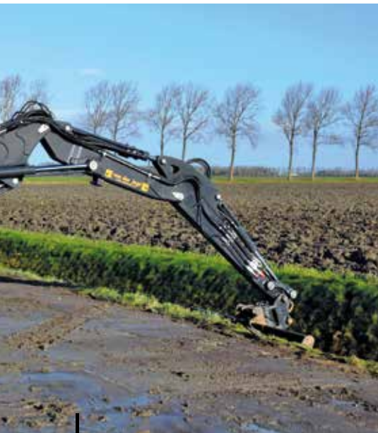
Dankzij een speciale, 2,5 m brede onderwagen weegt de machine nu 10.500 kg en heet daarom ES 105 TR.