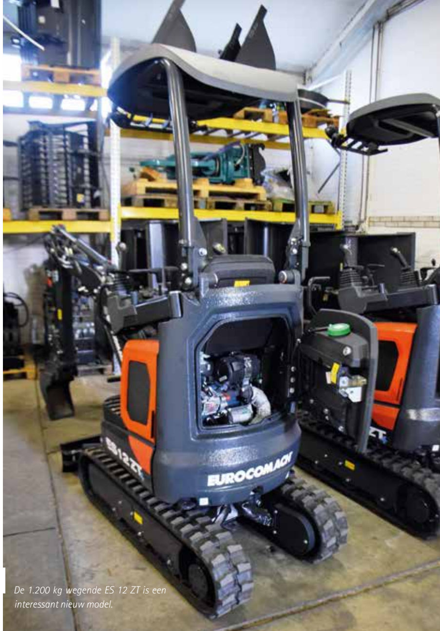
De 1.200 kg wegende ES 12 ZT is een interessant nieuw model.

Vanuit een nieuwe productielocatie met een