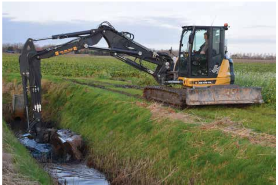
De verstelgiek biedt een groot werkbereik en ook over de zijkant is de machine zeer stabiel. Af-fabriek is al het leidingwerk netjes opgebouwd, met een speciale aftakking voor de snelwisselfunctie.